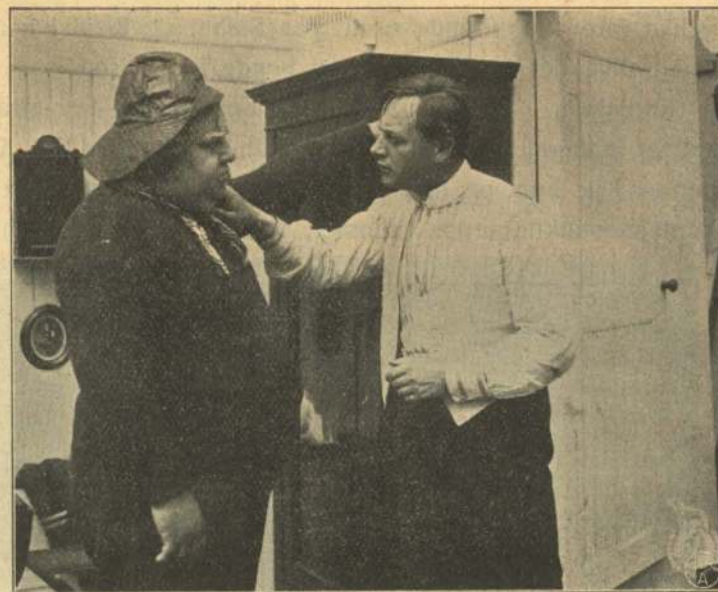
Den brave Baadsmænd og hans unge Ven.