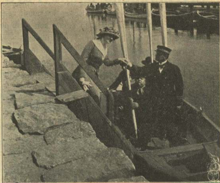
En kærkommen Gæst.